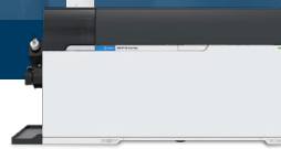
Agilent 8900 ICP-MS/MS