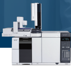
Agilent 5977B GC/MSD