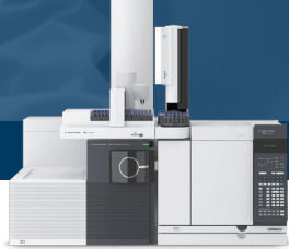
Agilent 7250 GC/Q-TOF