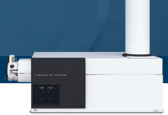
Agilent 6550 Q-TOF LC/MS