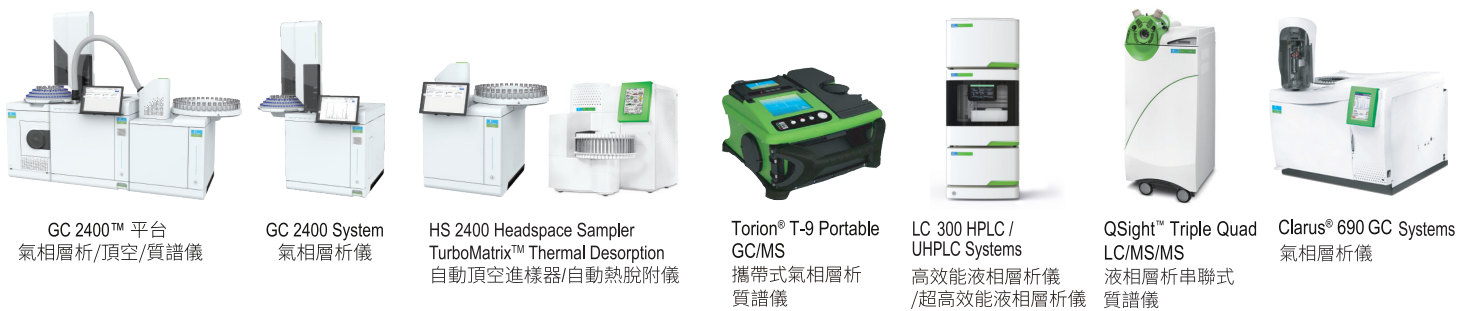
GC 2400™ 平台 氣相層析/頂空/質譜儀