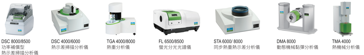
DSC 8000/8500 功率補償型熱示差掃描分析儀