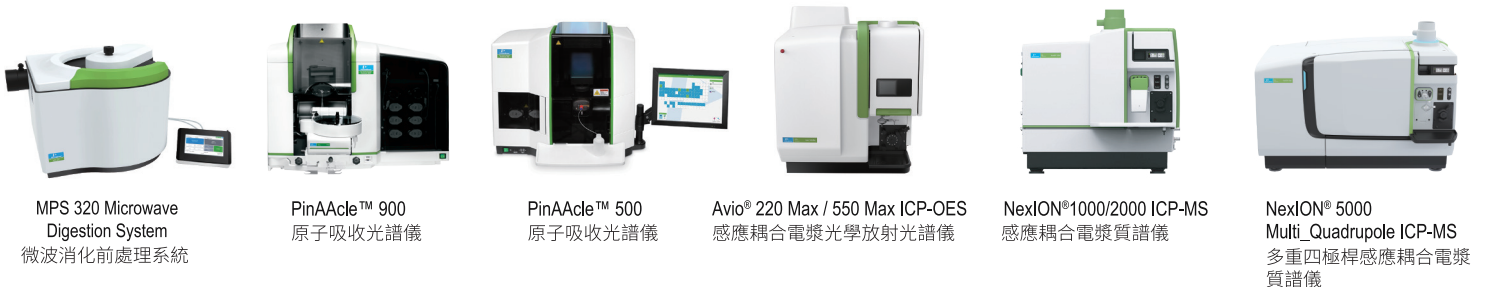
MPS 320 Microwave Digestion System 微波消化前處理系統