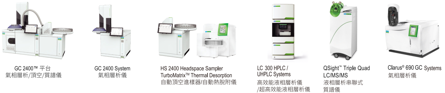
GC 2400™ 平台 氣相層析/頂空/質譜儀