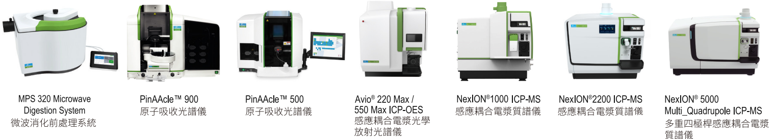
MPS 320 Microwave Digestion System 微波消化前處理系統